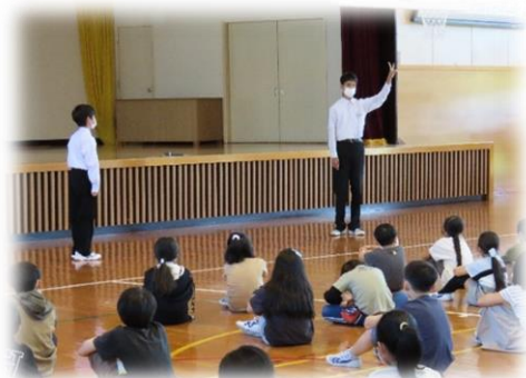
小学校を訪問し、あいさつをアピール！

10/3(月)～7(金)の5日間、春に続いてあいさつ運動を行いました。これまで以上にあいさつ運動を盛り上げようと、生徒会で様々な工夫をして取り組んでいました。まず、小中学校のみんなであいさつを意識できるキャッチフレーズを決めました。「おはよう！岩船」です。このキャッチフレーズのもと、取組を開始しました。生徒会の担当者が小学校を訪問し、全校集会で「あいさつの大切さ」を訴え、「よいあいさつの仕方」を実演しました。また、「地域全体であいさつを」とポスターを作成し、小中学校に掲示するだけでなく、地域に回覧もしました。