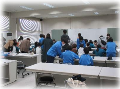
体験授業は保護者も一緒に挑戦！