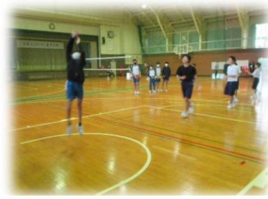
「せひ入部を」と各部がアピール