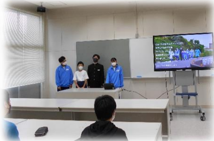
準備したスライドで学校生活の説明です

岩船小学校の6年生に、中学校生活について知ってもらい、安心して入学してもらおうと1年生11名が準備をして当日を迎えました。6年生にとって、先輩の姿はどう映ったのでしょうか？岩中生全員が「皆さんの入学を楽しみにしている」という思いは伝わったのでしょうか？4月から一緒に岩船中学校で生き生きと学んでもらえることを心から願っています。お待ちしております。