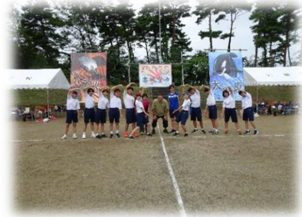
体育祭を成功に導いた3年生に感謝！