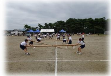
勝負が白熱した竹取り