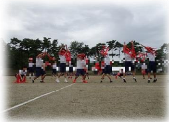
両チームのテーマ表現した応援パフォーマンスでの姿は、まさに岩風堂々でした

閉会式では、勝敗に関係なく、チームや全校生徒に感謝する体育祭リーダーの言葉で、全校生徒が心を1つにしました。フィナーレでは、全校生徒で、紅・蒼それぞれの大玉を送り、大漁旗のもとで記念撮影を行いました。応援いただきました保護者、地域の皆様に、岩船中学校の生徒の素敵な姿を見ていただくことができました。