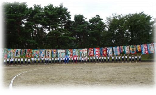
今年も、全校生徒で記念撮影しました