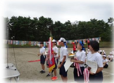
総合優勝は紅軍。どの部門も接戦で、賞を分け合いました