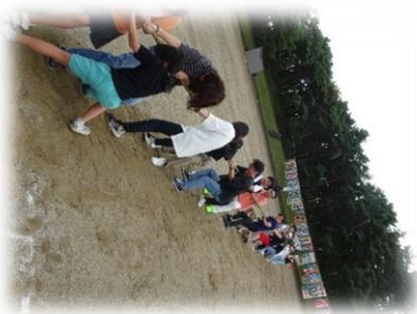
大勢の参加があったP T A種目