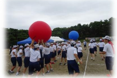
フィナーレでは、紅・蒼の大玉を送り、大漁旗のもとへ。